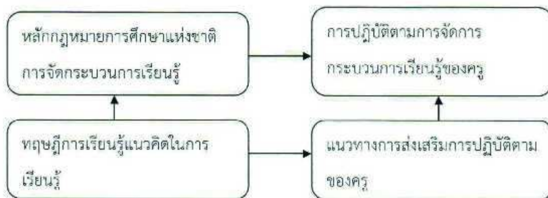
แผนภูมิ : กรอบแนวคิดในการวิจัย